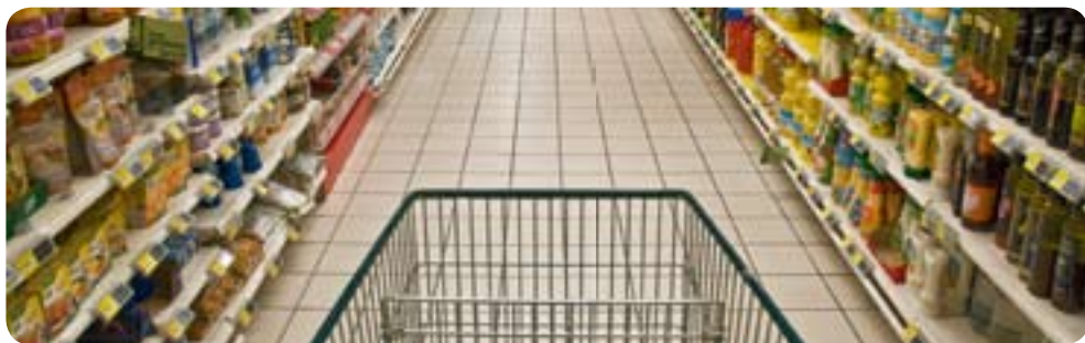
Supermercato – Alimentazione

uso delle opportunità offerte dalla procedura di notifica della direttiva 98/34/CE. Da venticinque anni a questa parte, sulla base della precedente direttiva 83/189/CEE, le aziende possono chiedere aiuto qualora temano che nuove regolamentazioni nazionali in altri Stati membri possano ostacolare le vendite dei propri prodotti. Le norme sono applicate anche da Norvegia, Islanda e Liechtenstein, parti dello Spazio economico europeo (SEE), e dalla Turchia. La Svizzera effettua le notifiche su base volontaria.