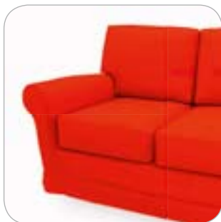
Sofà rosso

Un progetto di regolamentazione nazionale richiedeva che la non infiammabilità dei mobili imbottiti fosse garantita da un'etichetta visibile, leggibile e indelebile. I mobili dovevano anche essere accompagnati in tutte le fasi di commercializzazione da una scheda di identificazione tecnica con informazioni relative al loro impiego adeguato, le istruzioni per l'uso e le precauzioni da rispettare.