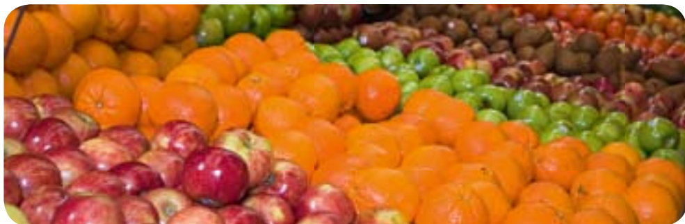
Reparto frutta