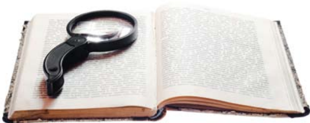
Lente di ingrandimento su testo d'epoca

La procedura 98/34 consente anche agli Stati Membri di far tesoro di esperienze ed idee di altri Stati membri. Ciò è vero in particolare per l'esigenza di trovare soluzioni a problemi comuni relativi alle regolamentazioni tecniche, soprattutto nei settori di nuova regolamentazione.