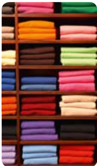
Pile di indumenti multicolori in lana

Alcuni progetti di regolamentazioni nazionali richiedevano l'etichettatura obbligatoria dei tessuti e delle calzature e obbligavano gli operatori economici ad aggiungere indicazioni per l'uso e per la manutenzione ad una serie di prodotti di consumo. A seguito di reazioni di altri Stati membri e della Commissione, lo Stato membro che aveva effettuato la notifica ha ritirato la propria normativa che, se adottata, avrebbe imposto oneri aggiuntivi e inutili ai produttori.